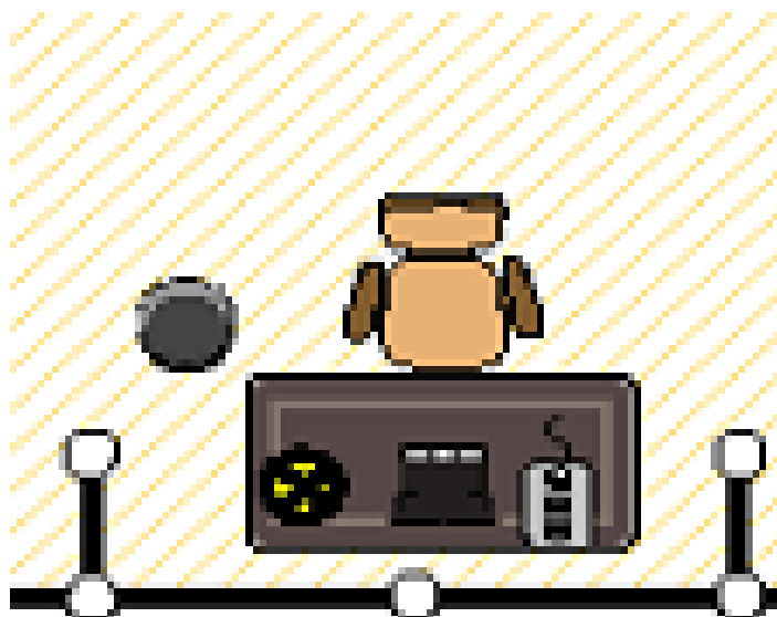
Схема компоновки рабочего места приводится только для справки.