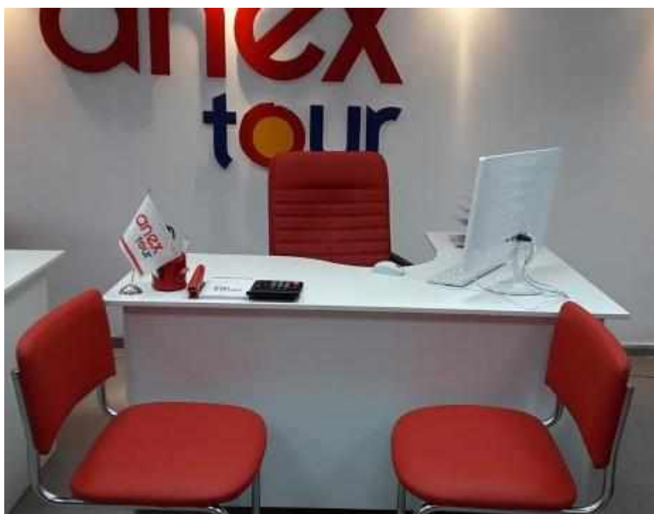
Рис. 1. Рабочее место участника (примерный вариант)

В данном разделе также приведены основные фото, эскизы необходимые для визуализации компонентов застройки конкурсной площадки.